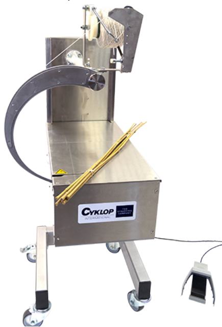
*De afgebeelde elastiekbinder is een rechter binder. Dit betekent dat de producten van links naar rechts worden ingevoerd.

< KLIK HIER VOOR EEN VIDEO VAN DE MD 35/60 XL >