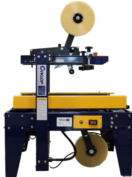
Standaard uitvoering van de CT 102 SD

De machine kan eenvoudig handmatig worden ingesteld op de benodigde doosbreedte en -hoogte. De dozen worden getransporteerd door middel van gemotoriseerde zijtransportbanden, waardoor de dozen perfect worden uitgelijnd en een goede afdichting wordt gegarandeerd.