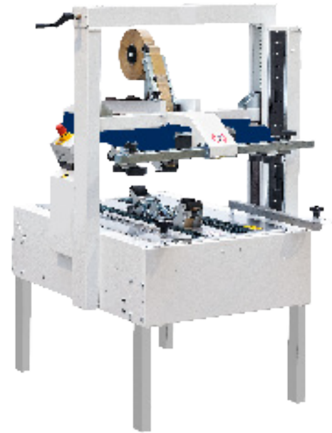
Standaard uitvoering van de CT 303 TB

De CT 303 SD is eenvoudig op de juiste hoogte en breedte in te stellen en het is mogelijk om duizenden verpakkingen per dag professioneel te sluiten.