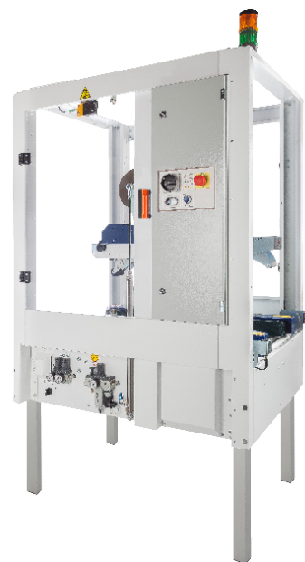
Standaard uitvoering van de CT 305 SDR