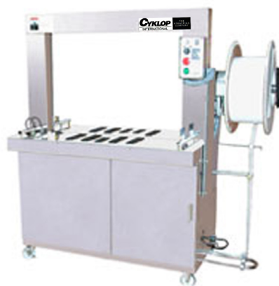
CI 89 M

Het semi-automatische model M-Pac YM is zeer goed beschermd tegen vocht. De RVS-stalen behuizing en de tegen roest beschermde onderdelen maken dit model geschikt voor vochtige omstandigheden. De instelbare tafelhoogte, de eenvoudige bediening en de investeringsvriendelijke prijs kenmerken de M-Pac YM.