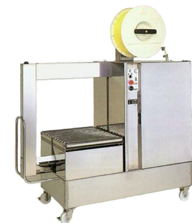
CI 89 YM

Het volautomatische model CI 89 YM Volautomaat is eenvoudig, naar klanteis, in te bouwen in een volautomatische verpakkingslijn. Dit model heeft een zeer hoge betrouwbaarheid en stabiliteit en vormt mede door de standaard componenten een economisch aantrekkelijke oplossing. Zijpusher, aandrukbalk en pakketseparator zijn eenvoudig in te passen. Door de vele gebruiksmogelijkheden en eigenschappen is de CI 89 YM Volautomaat inzetbaar in meerdere branches.